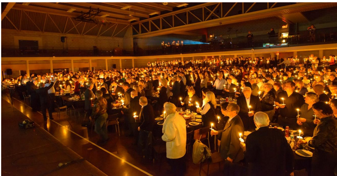
Dijeljenje plamena “Vukovarskog svjetla“, Toronto, 1200 gledatelja i 150 izvođača

Spektakl “ Plamen Vukovarskog svjetla“ je glazbeno-scenska predstava kroz koju pričamo priču o gradu Vukovaru prije rata, kako je grad branjen tijekom “Bitke za Vukovar“ i o gradu Vukovaru danas. Tijekom spektakla prikazuje se tri filma: “Plamen Vukovarskog svjetla“, “Bitka za Vukovar“ i “Vukovar danas“ te se održavaju ceremonije unošenja, blagoslova i dijeljenja plamena donesenog iz grada Vukovara.